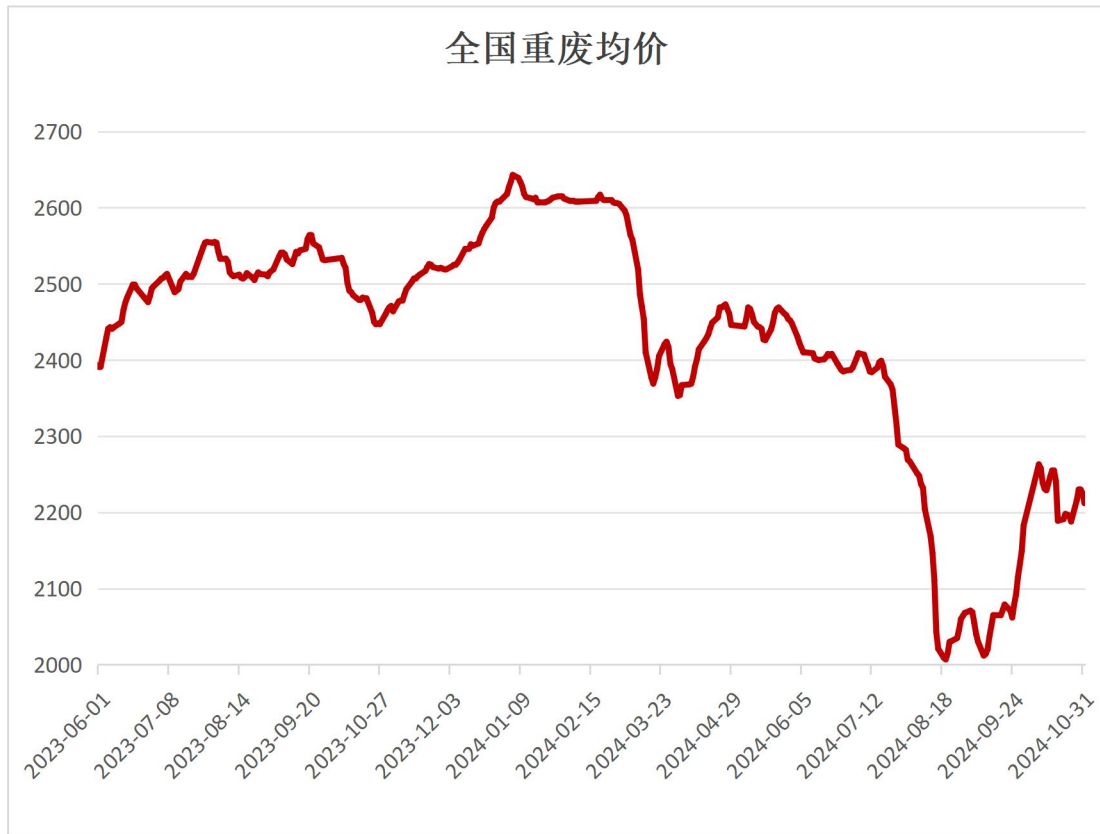
图 1 全国重废市场价格变动情况（均价）

根据中钢网大数据库统计显示，本周国内 32 个主流城市废钢均价为 2212 元/吨左右，较上周价格上涨 24 元。