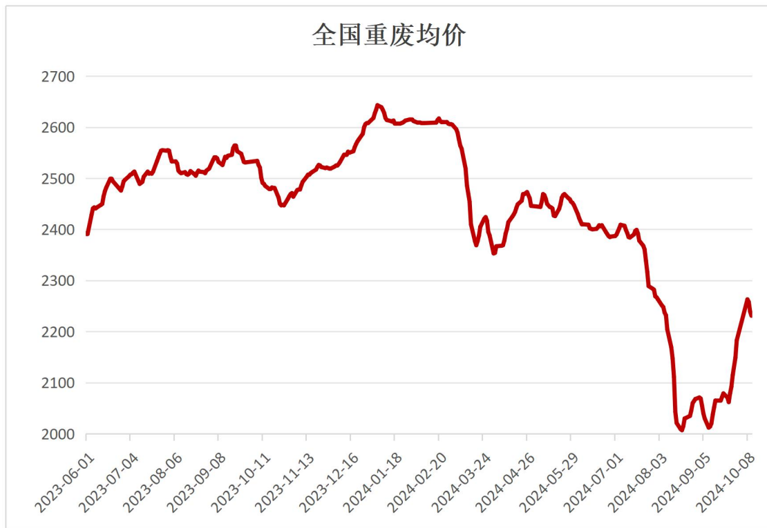
图 1 全国重废市场价格变动情况（均价）

根据中钢网大数据库统计显示，本周国内 32 个主流城市废钢均价为 2231 元/吨左右，较周二价格下跌 32 元。